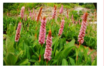
ヒマラヤトラノオ