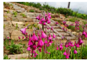
プリムラ・セクンディフロラ