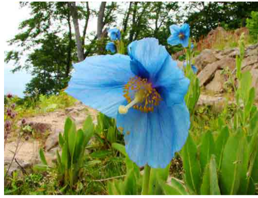
ヒマラヤの青いケシ

今年は、雪解けがとても早く、花の開花も半月ほど早いです。早速、コマクサの花は見ごろです。ヒマラヤの青いケシも咲き始め、これから開花数が増えてきます。ロックガーデンでは、外国の高山植物も楽しめます。