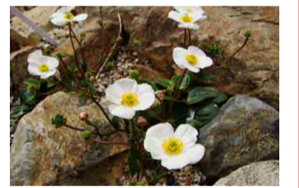
ランンキュラス・バルナシフォルイウス