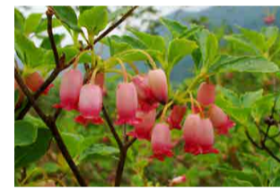
ウロジロヨウラク