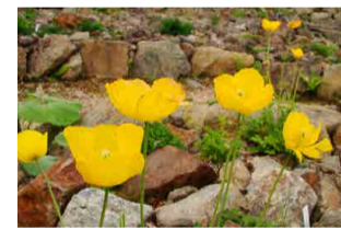
メコノプシス・カンブリカ