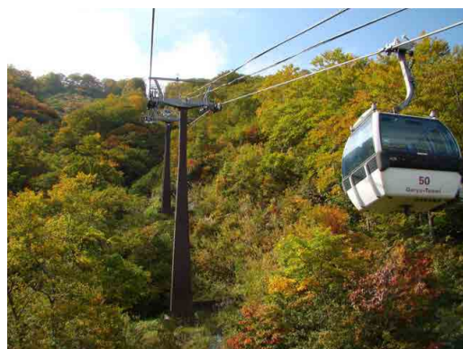
ゴンドラテレキャビン山頂付近

植物園内、花数は少なくなりましたが、マツムシソウやミヤマトリカブトなど、秋の花を見られます。