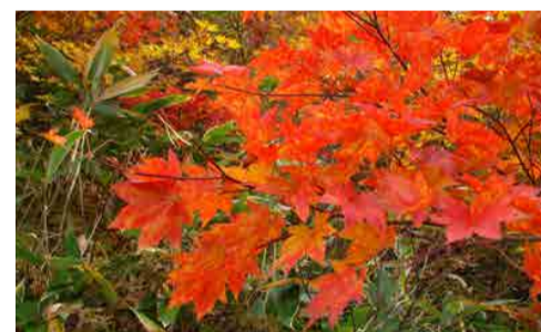
遊歩道で色づくカエデ