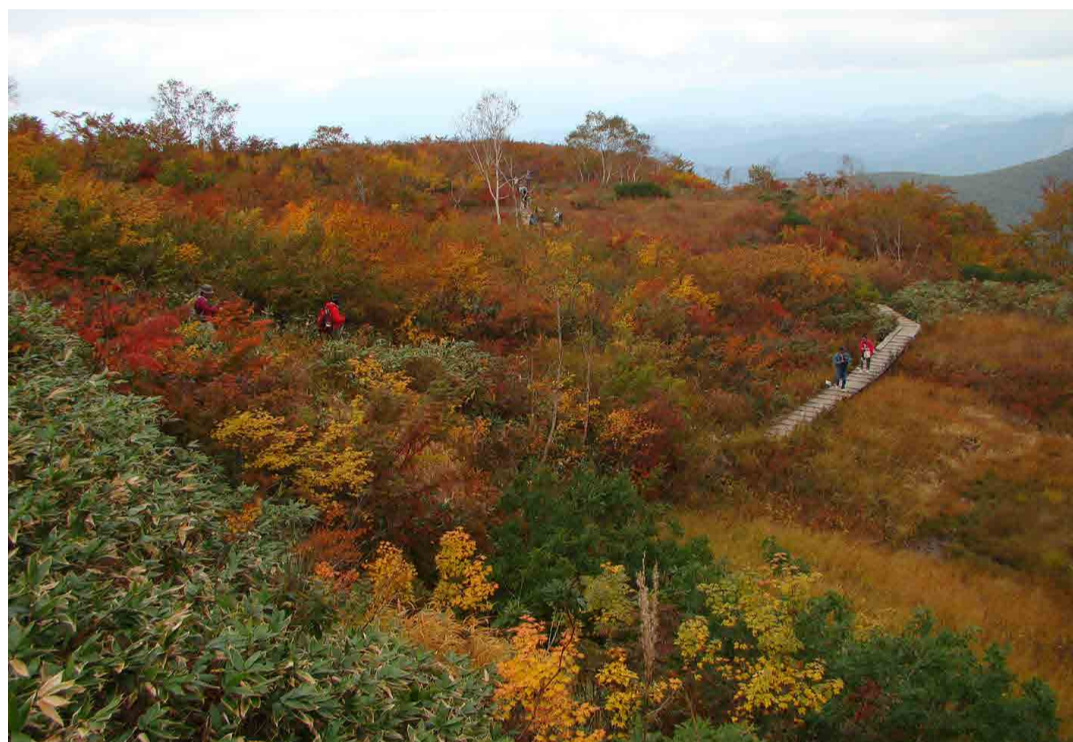
アルプス平自然遊歩道