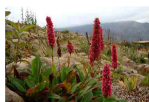
ヒマラヤトラノオ