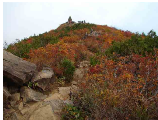
アルプス平自然遊歩道