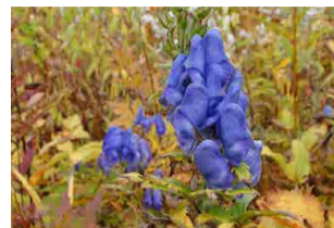
ミヤマトリカブト