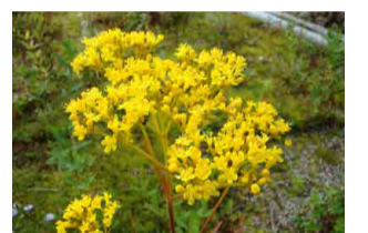
ハクサンオミナエシ