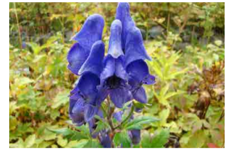
ミヤマトリカブト