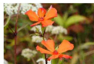
フシグロセンノウ