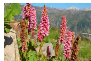
ヒマラヤトラノオ