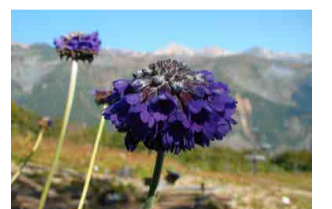
プリムラ・カピタータ ・ムーレアナ