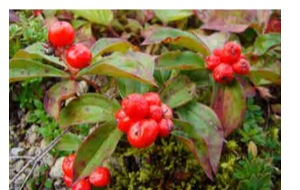
ゴゼンタチバナ(実)