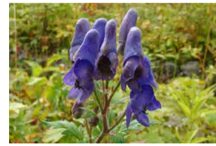
ミヤマトリカブト