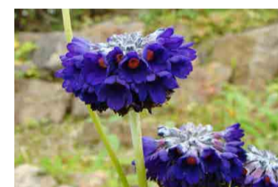
プリムラ・カピタータ ・ムーレアナ