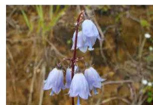
ハクサンシャジン