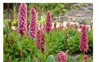
ヒマラヤトラノオ