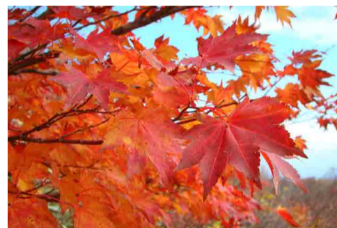
赤く色づいたモミジ