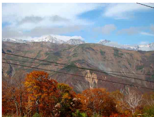
うっすら雪をかぶった白馬三山

北アルプスが白く雪をかぶり、今年、2度目の冠雪がありました。紅葉は、ゴンドラの中腹くらいまで色づき、ぐんぐんと山をかけおっています。