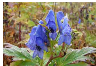
ミヤマトリカブト