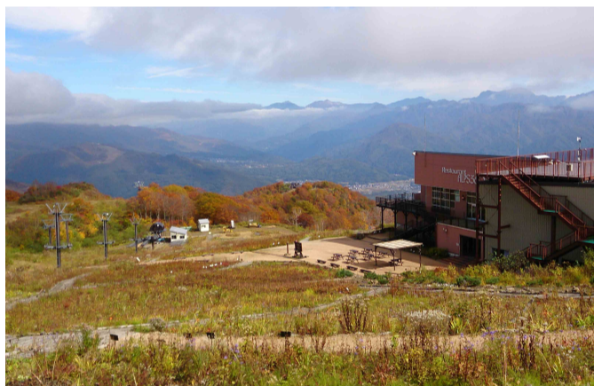
高山植物園(アルプス平駅周辺)