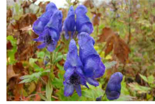
ミヤマトリカブト