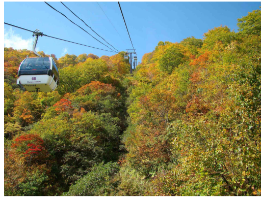
ゴンドラテレキャビン山頂付近

植物園周辺がちょうど紅葉の見ごろを迎えています。 ゴンドラ山頂付近も色づき、見頃まで、もう少し…というところです。 植物園内、花数は少なくなりましたが、ミヤマトリカブトやマツムシソウなど秋の花が見られます。