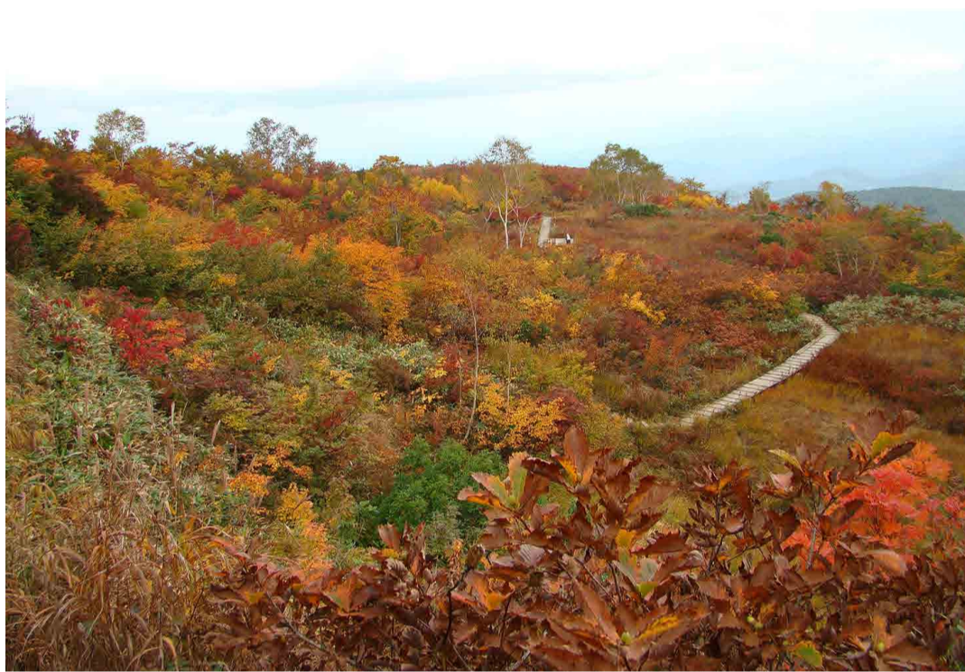
アルプス平自然遊歩道