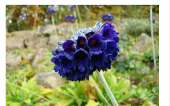
プリムラ・カピタータ ・ムーレアナ