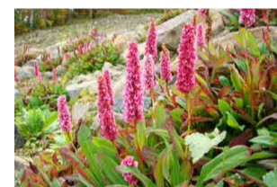
ポリゴナム・アフィネ