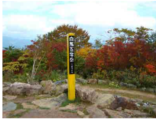
植物園内ロックガーデン

例年より少し早く、木々が赤に黄色にと色づき、自然遊歩道は、紅葉の見ごろを迎えています。紅葉は、来週には、ぐんぐんと山を駆け下りそうです。植物園内では、マツムシソウやミヤマトリカブト、リンドウ、ノコンギクなど、秋の花を見られます。