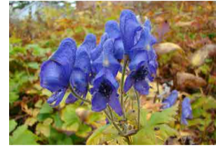
ミヤマトリカブト