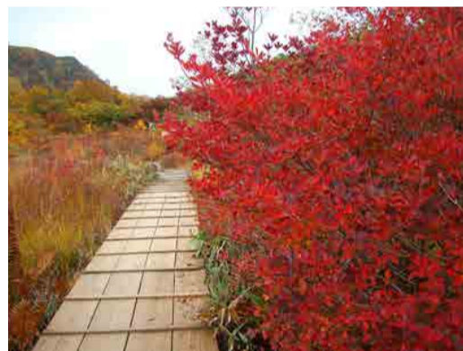
遊歩道で真っ赤に色づいたツツジ