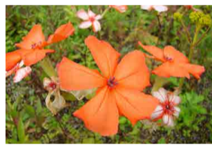
フシグロセンノウ