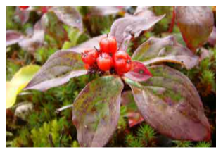
ゴゼンタチバナ(実)