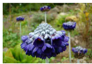
プリムラ・カビタータ ・ムーレアナ