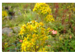
アキノキリンソウ