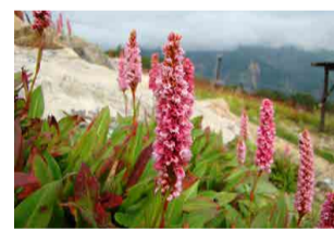
ポリゴナム・アフィネ