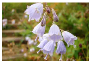
ハクサンシャジン