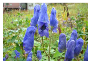
ミヤマトリカブト