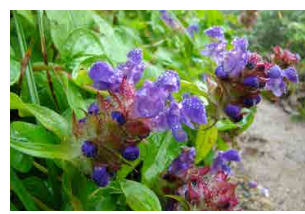
タテヤマウツボグサ