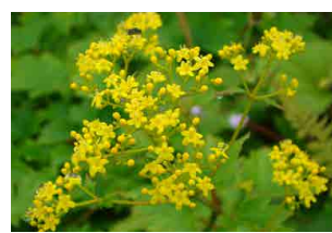
ハクサンオミナエシ