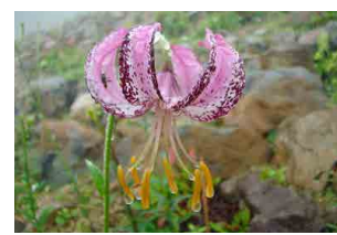
リリウム・ ランコンゲンセ