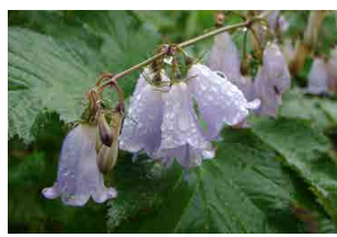
ハクサンシャジン