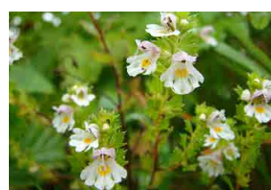
ミヤマコゴメグサ