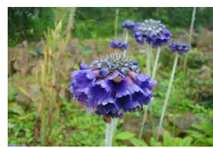
プリムラ・カビタータ ・ムーレアナ