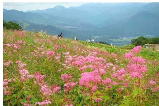
アカバナシモツケソウ

アカバナシモツケソウが群生となって見られるようになりました。クガイソウ、コオニユリ、キンコウカなど自然のままをゆっくり散策してご覧ください。