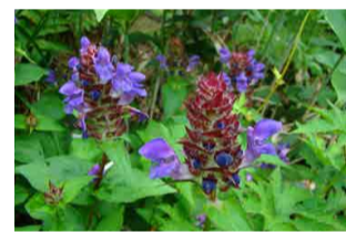
タテヤマウツボグサ