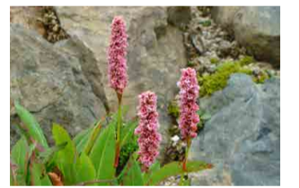
ポリゴナム・アフィネ