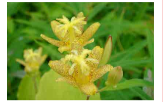
タマガワホトトギス