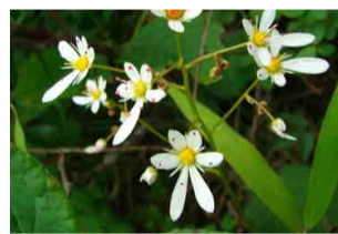
ミヤマダイヤモンドソウ