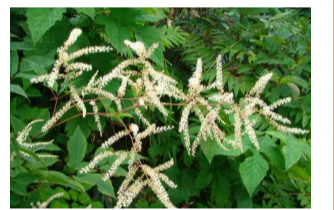
ヤマブキショウマ