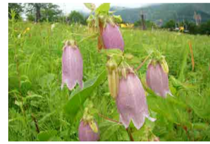
ヤマホタルブクロ