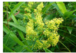
キバナノカワラマツバ