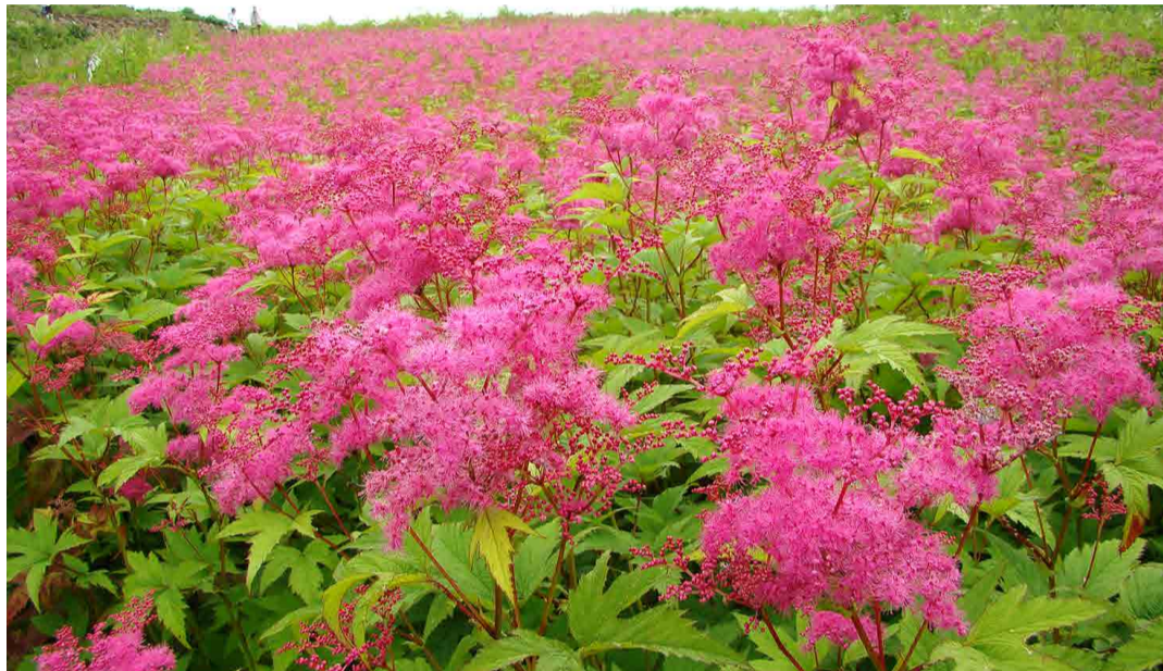
アカバナシモツケソウ