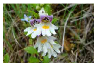
ミヤマコゴメグサ