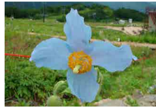
ヒマラヤの青いケシ