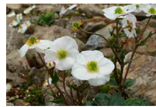
ランキョウス・バルナシフォルウス