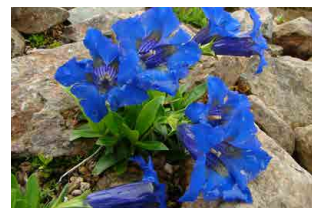
ゲンチアナ・アコーリス