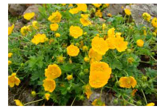
ヒメアカネキンバイ