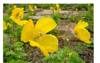
メコノプシス・カンブリカ