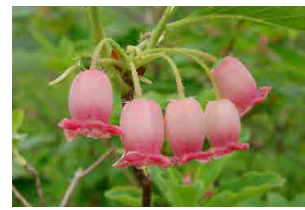
ウラジロヨウラク