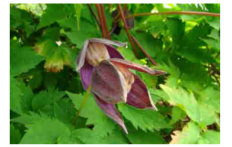
ミヤマハンショウヅル