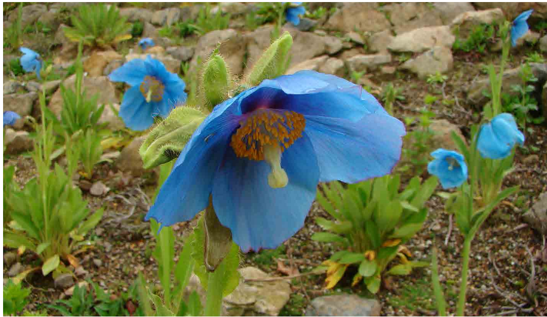
ヒマラヤの青いケシ