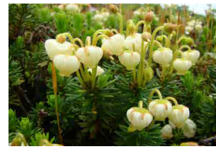
アオノツガザクラ